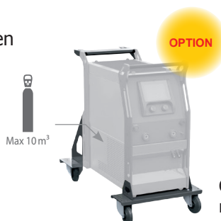
Chariot ref. 040960

À l'aide d'une option facile à poser, il peut se transformer en poste sur roues avec support bouteille 10m 3 .