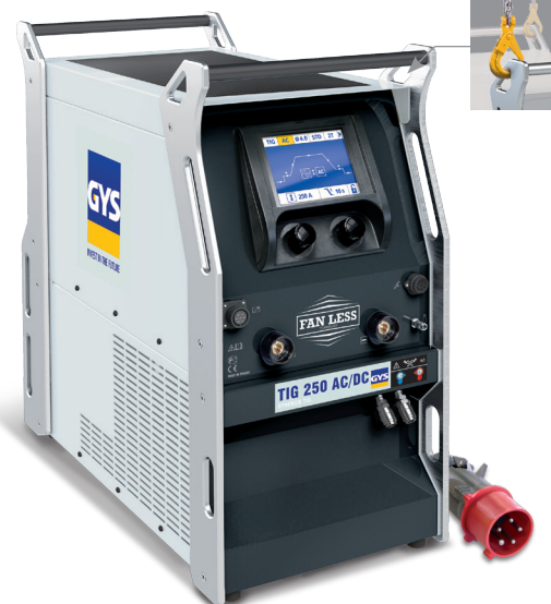
Livré sans accessoires

Mode Easy ou mode PRO pour un accès complet des paramétrages.